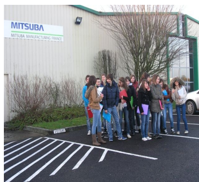
Groupe DP3 devant MISTUBA

Dans cette société japonaise il y a deux catégories de personnes : Les Directs à qui on affecte sur des machines. Les Indirects s'occupent de l'administration, de la maintenance, à qualité de la production.